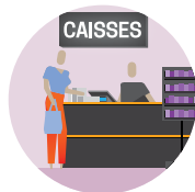
ENTRE PROFESSIONNEL ET CONSOMMATEUR